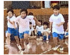
運動会練習・本番