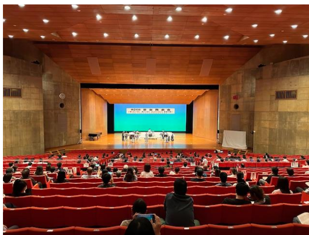
西崎特支の発表の様子