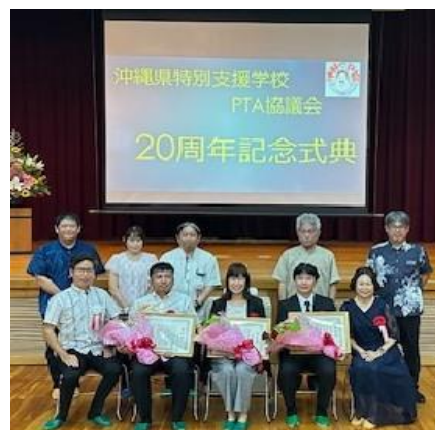
沖特P役員・受賞者の記念撮影