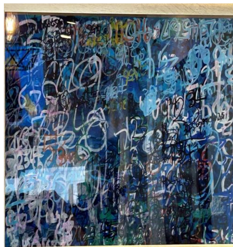
作品：数字の楽しさ